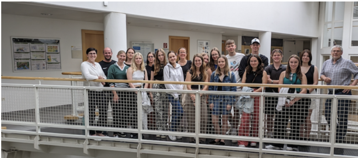
Besuch der 4BHLW am Department für Ernährungswissenschaften

Wir bedanken uns bei der 4B und ihren Lehrkräften für den Besuch und freuen uns schon jetzt auf ein Wiedersehen mit der einen oder dem anderen als Studierende am Department für Ernährungswissenschaften!